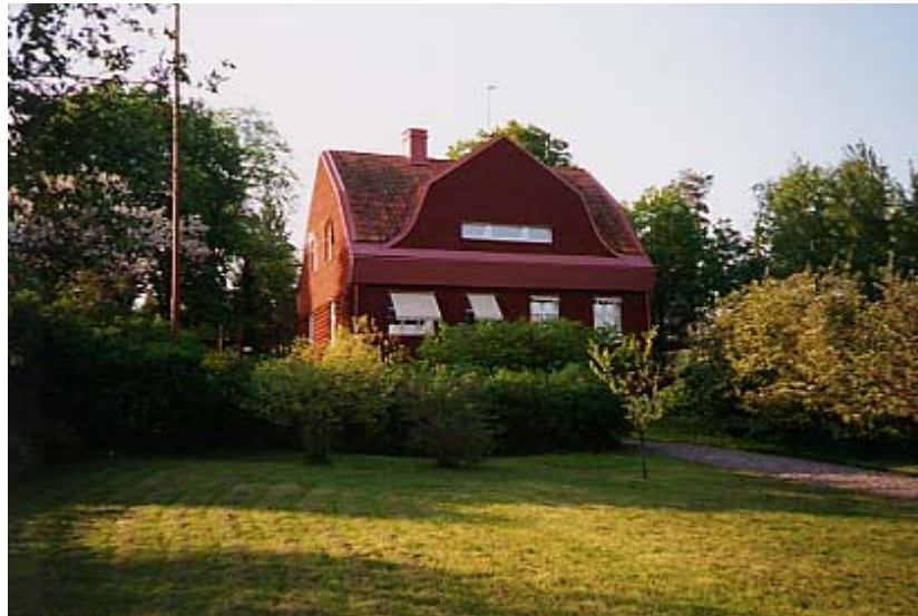
Sofieberg 1999