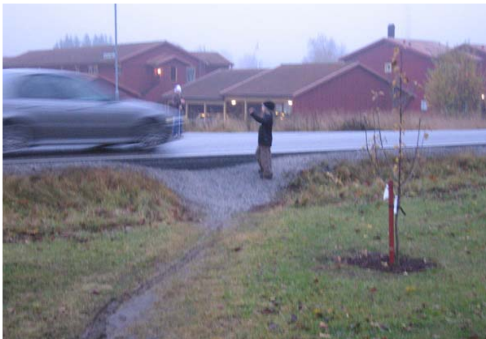
"Övergångsstället" vid Humlevägen i oktober 2005

En av de frågor som diskuterades livligt vid mötet 2005 var frågan om genomfartstrafiken i Lindholmen. En allmän uppfattning bland deltagarna var att trafiken genom Lindholmens tätort har ökat kraftigt och att den ofta sker utan hänsynstagande till gällande hastighetsbegränsningar. För gående, speciellt barn vid skolan och idrottsplatsen, samt för cyklister utgör detta en betydande fara och frågan är inte OM utan NÄR en allvarlig trafikolycka kommer att ske. Dålig belysning och avsaknad av särskilda gångbanor, bl a på vägen mot fotbollsplan och bygdegård, ökar dramatiskt risken för olyckor. Läs mer om mötet 2005 >>>