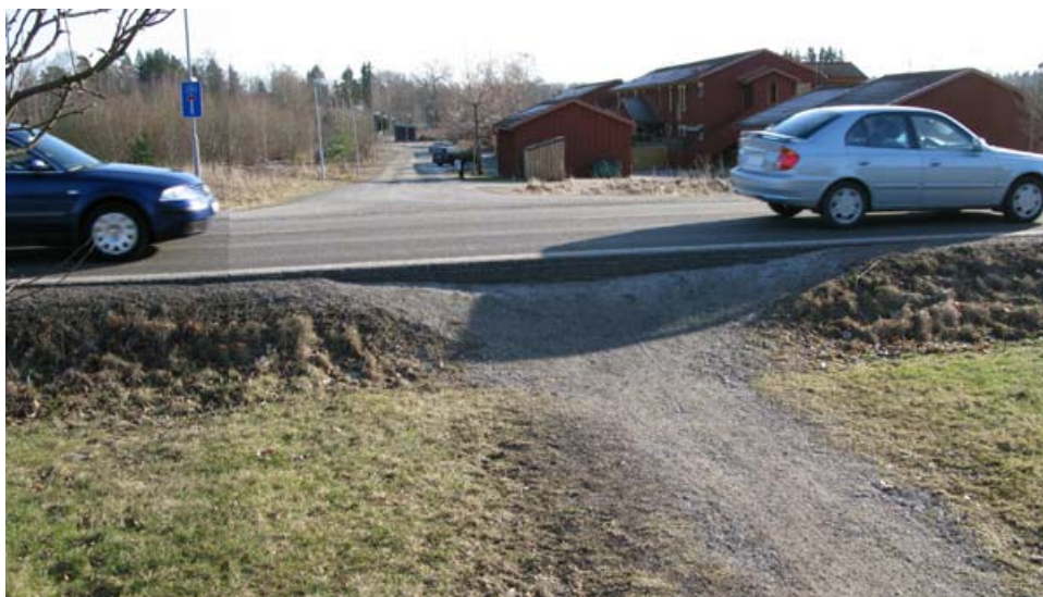
Samma "övergångsställe" vid Humlevägen två och ett halvt år senare (februari 2008). Inget har gjorts för att förbättra säkerheten för de gående som ska korsa vägen!

Efter mötet 2005 sammanställde hembygdsföreningen ett antal viktiga frågor för Lindholmen i en skrivelse , som tillsammans med namnunderskrifter från de boende, lämnades in till Samhällsbyggnadsförvaltningen. I skrivelsen framgick att de undertecknade förväntade sig att kommunledningen snarast skulle se över rådande trafikförhållanden på genomfartsvägen i Lindholmen. Det var vår uppfattning att det behövdes ytterligare minst ett till övergångsställe, nedsatt hastighet kombinerat med andra farddämpande åtgärder, förbättrad belysning samt gångbanor vid vägavsnittet fram till fotbollsplan och bygdegård. Vi påpekade också att vi betraktade dessa åtgärder som kortsiktiga och att vi förväntade oss